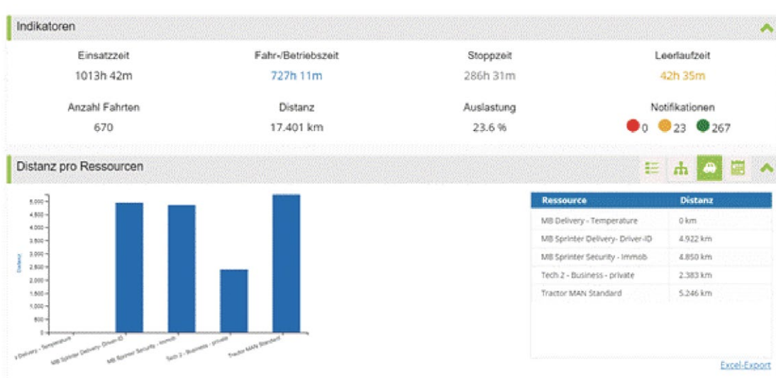
Illustration: Tableau de bord de gestion Vehicle Connect